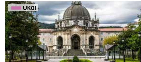
Loiola / Azpeitia