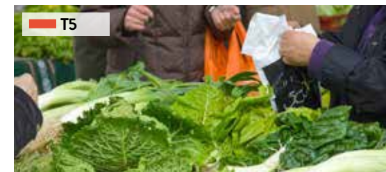
Gastronomia Gipuzkoaren barrenean /

Deba - Mutriku - Zumaia Geoparque UNESCO de la Costa Vasca / UNESCO Geopark of the Basque Coast / UNESCO Géoparc de la Côte Basque