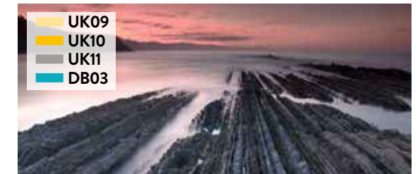
Euskal Kostaldeko UNESCO Geoparkea /

Deba - Mutriku - Zumaia Geoparque UNESCO de la Costa Vasca / UNESCO Geopark of the Basque Coast / UNESCO Géoparc de la Côte Basque