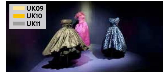
Cristóbal Balenciaga / Getaria