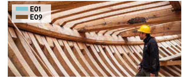
Albaola / Pasai San Pedro